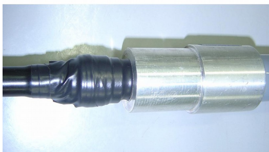
Isolação da conexão

Tendo todos estes cuidados, você garantirá um bom funcionamento do produto por muito tempo.